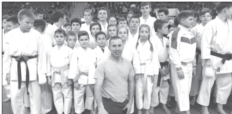
«Молодые ветра» не подкачали

В г.Троицке Московской области прошло первенство ЦФО по восточным боевым единоборствам. Участие в первенстве приняли 700 спортсменов.