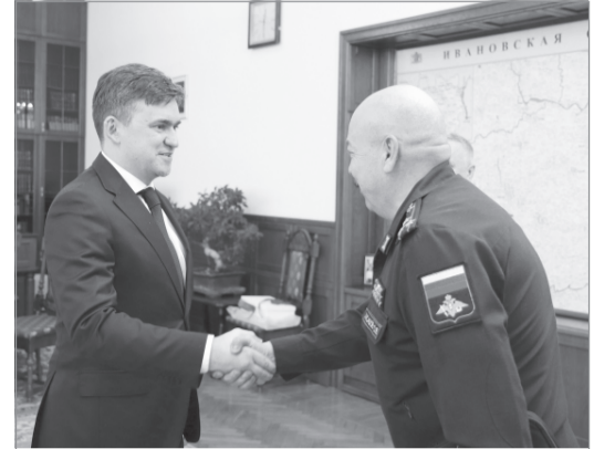
Губернатор области Станислав Воскресенский и новый военком региона Олег Хасабов

Губернатор Ивановской области Станислав Воскресенский провел рабочую встречу с военным комиссаром региона Олегом Хасабовым, который приступил к должностным обязанностям.