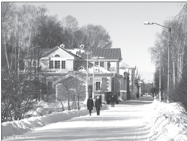
Объектам культурного наследия - особое внимание