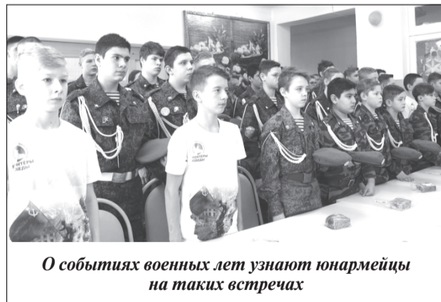
О событиях военных лет узнают юнармейцы на таких встречах