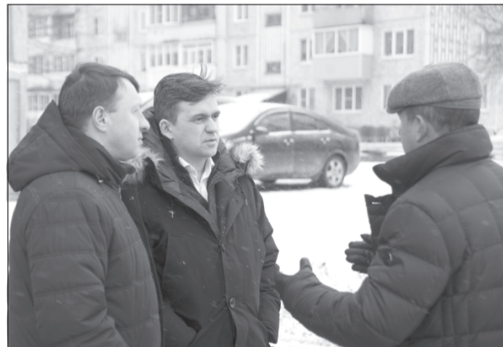
Проблема обращения с ТКО - одна из главных в ходе посещения губернатором Ивановского района.

В рамках рабочей поездки в Ивановский район Станислав Воскресенский провел встречу с общественностью, во время которой в формате круглого стола обсудил основные проблемные вопросы. В частности, жители района задали ряд вопросов о ремонте дорог, уличном освещении, благоустройстве, создании мест в детских дошкольных учреждениях.