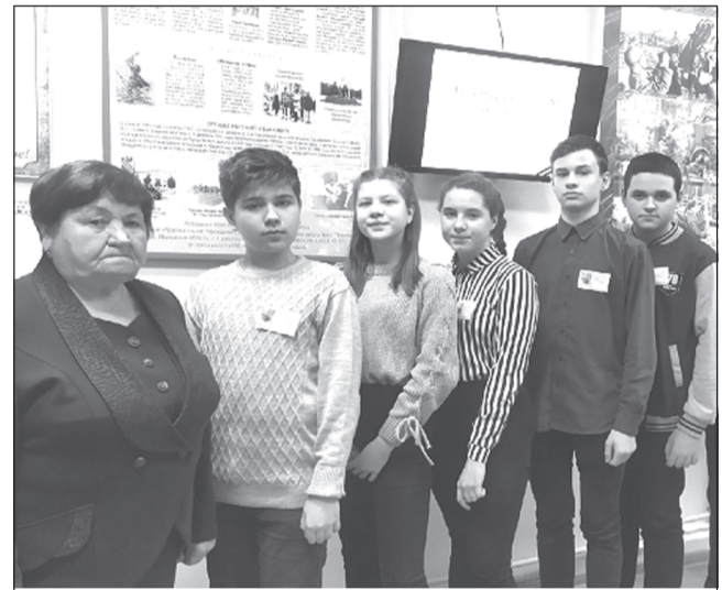
Урок мужества в музее школы №6