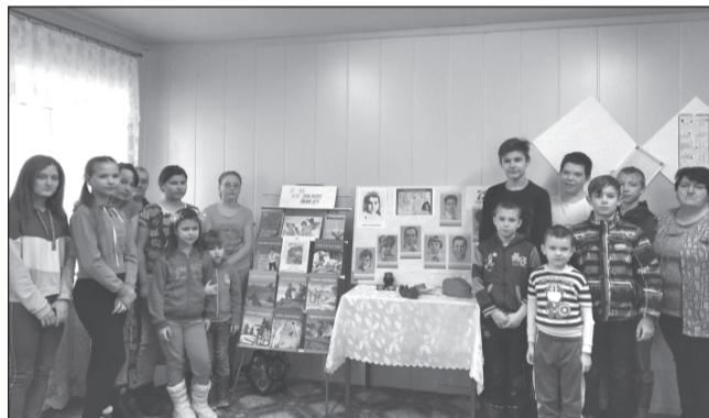
«Хлеб той зимы...» - выставка-экспозиция с таким названием прошла в ДК с.Горки-Чириковы